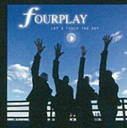
FOURPLAY 「レッツ・タッチ・ザ・スカイ」 (ユニバーサル ミュージック) 2010.11.3発売

フュージョン～コンテンポラリー・ジャズ界の頂点に立つユニットが、日本を代表するオーケストラと一夜限りのコラボレーションを果たす。11月に新作『レッツ・タッチ・ザ・スカイ』を発表するフォープレイと、新日本フィルハーモニー交響楽団の共演だ。数々のグラミー賞に輝くキーボード奏者/アレンジャー、ボブ・ジェームス。エリック・クラプトンからの信頼も厚いベーシスト、ネイサン・イースト。プロデューサーとしても引っ張りだこのドラマー、ハーヴィー・メイソン。この不動の3人に、ギターの名手チャック・ローブを迎えた新生フォープレイが、いま勢いのある新日本フィルと共にどんな世界を創り出すのか。彼らのネクスト・ステップを見逃すわけにはいかない。